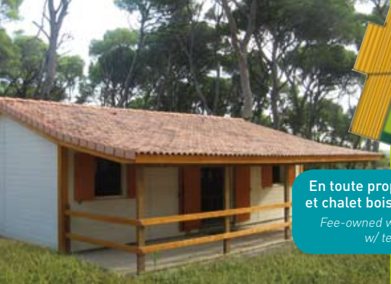
En toute propriété, terrain et chalet bois avec terrasse Fee-owned wooden chalet w/ terrace